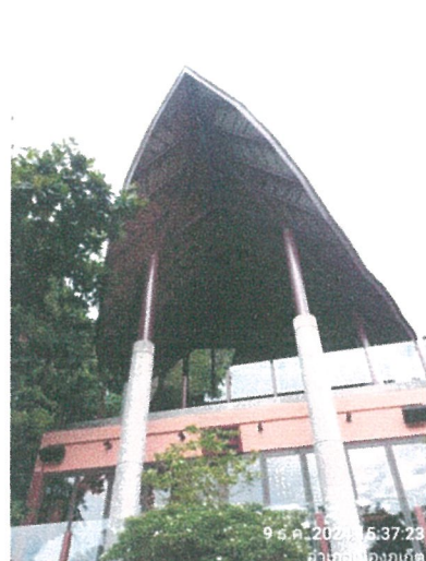
รูปภาพที่ 1.3 การใช้พื้นที่ของโครงการ